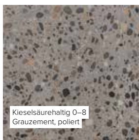
Kieselsäurehaltig 0–8 Grauzement, poliert