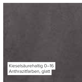
Kieselsäurehaltig 0–16 Anthrazitfarben, glatt