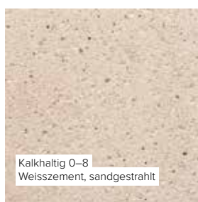
Kalkhaltig 0–8 Weisszement, sandgestrahlt