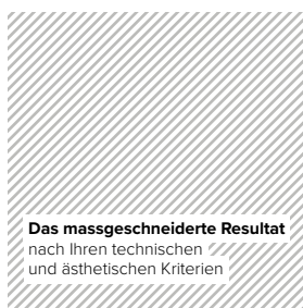
Das massgeschneiderte Resultat nach Ihren technischen und ästhetischen Kriterien