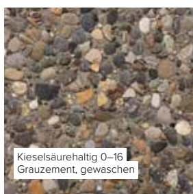
Kieselsäurehaltig 0–16 Grauzement, gewaschen