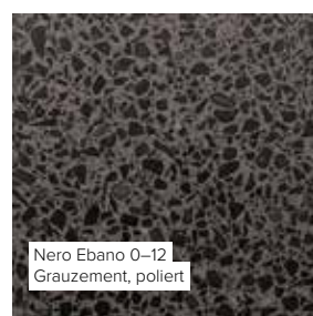
Nero Ebano 0–12 Grauzement, poliert