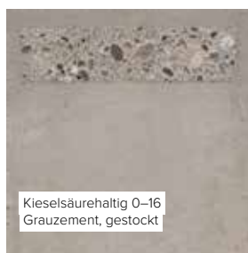
Kieselsäurehaltig 0–16 Grauzement, gestockt